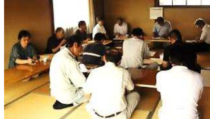
↑現場説明会の様子

◎6月に実施しました平成26年度家屋修理希望調査アンケートをもとに7月13日(土) 家屋修理希望者の現地視察を実施しました。